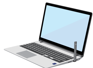
컴퓨터를 활용해 충전가능 (이럴 경우 마치 USB를 사용하는 것처럼 보일 수 있음)