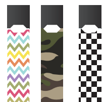
줄을 취향에 맞게 꾸밀 수 있는 스티커