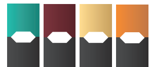
팟(액상카트리지) 맛에 따라 색상이 다름